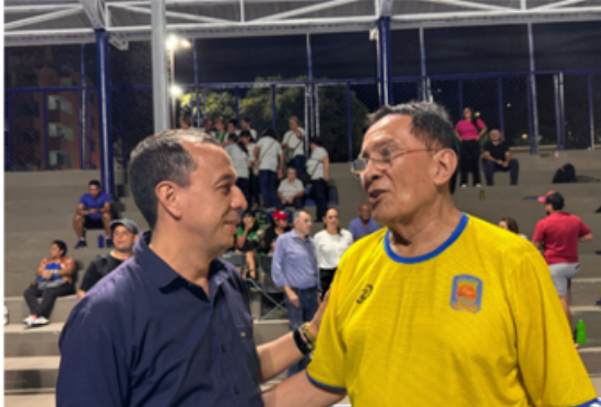
Inauguración del polideportivo las américas