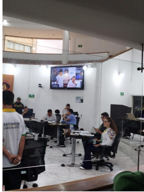
REDMI Note 13