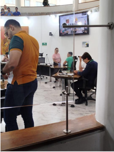
REDMI Note 13