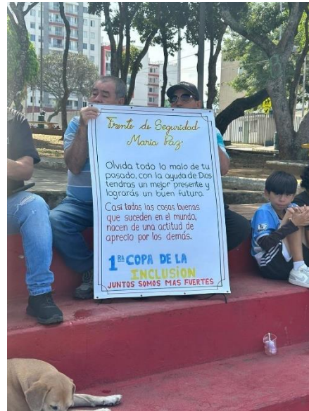
participamos de la actividad reliazadas en cristo rey – copa de inclusion.