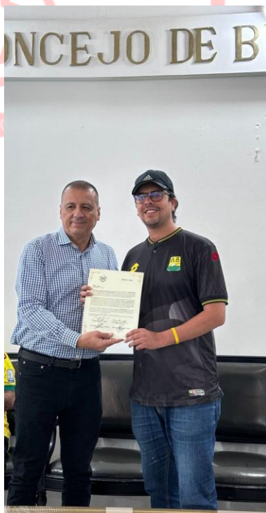
condecoración de ediles en la en la sesión plenaria