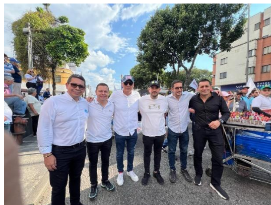
Apoyamos la marcha por la defensa del agua