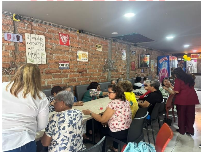
Celebramos el día de la mujer con un grupo de adulto mayor barrio el rocío