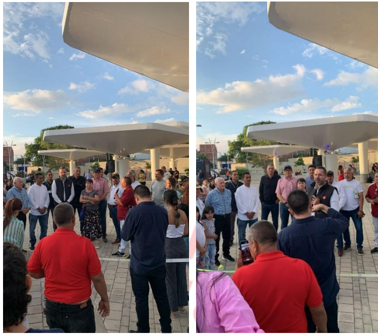
Acompañamos la entrega del parque en el barrio paseo la feria.

Para la vigencia 2024, se realizaron diferentes gestiones con la comunidad, resaltando aquí algunas gestiones que se llevaron a cabo en diferentes fechas especiales o por solicitud de la comunidad en general.