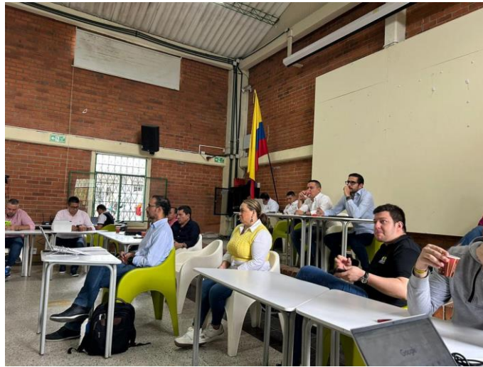
Asistimos a las sesiones descentralizadas que se reliaizaron en las zonas urbanas y rurales de la ciudad de bucamanga