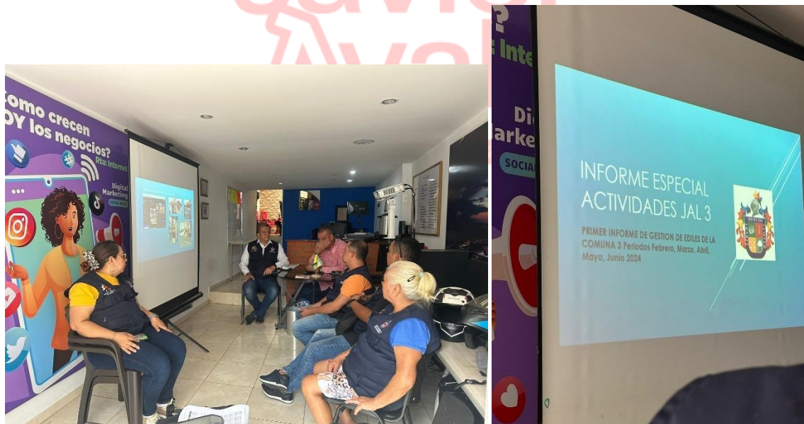
Asistimos a reunión con grupo de ediles comuna 3 san francisco para escuchar sobre las necesidades y búsqueda de soluciones.