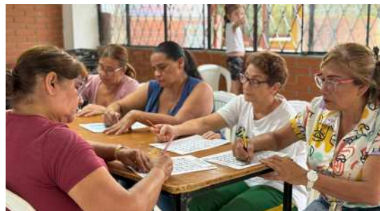
SEMILLEROS PERSONA MAYOR