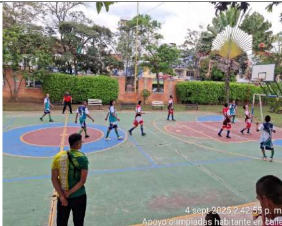
OLIMPIADAS HABITANTE EN CALLE