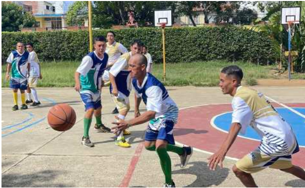
DEPORTE + HABITANTE EN CALLE