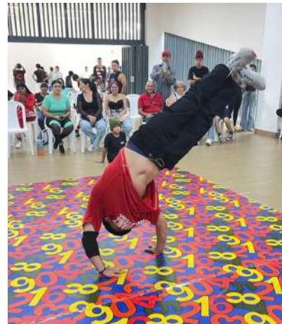
SEMILLERO DANZA URBANA