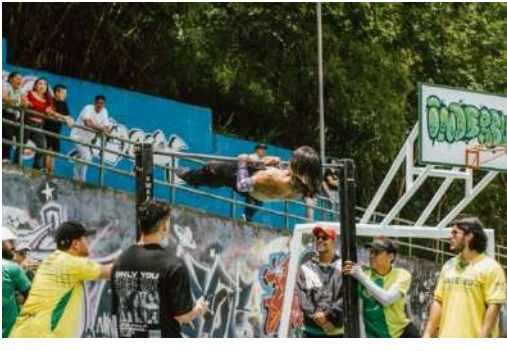
XTREME MÁSTER FEST