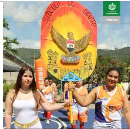
DEPORTE + CENTROS CARCELARIOS