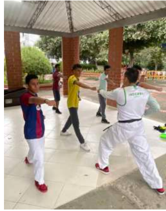
SEMILLERO DEPORTIVO ARTES MARCIALES