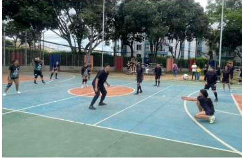
SEMILLERO DEPORTIVO VOLEIBOL