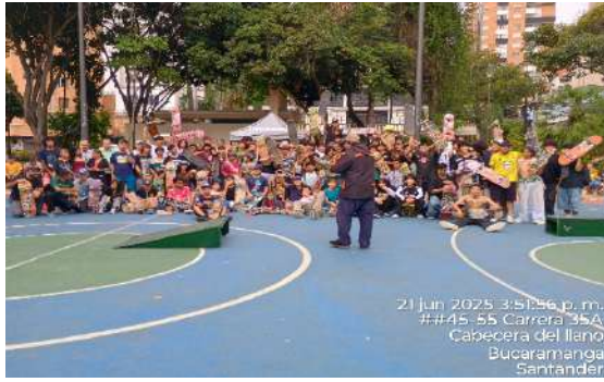
FESTIVAL SKATE BOARDING