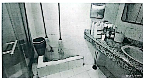
Ilustración 5. Reubicar la zona de lavado y almacenamiento de productos