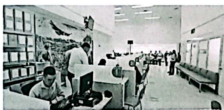
Evidencia 5. Reorganizar los módulos en orden de numeración ascendente