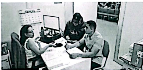
Evidencia 4. Reunión de profesionales de SST con la coordinadora general del CAME

Por último, se recomienda ordenar los cubículos o módulos en orden ascendente de acuerdo a las necesidades y organización definida por la oficina del CAME.