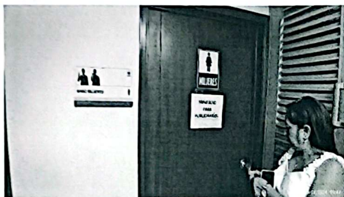
Ilustración 3. Baños que se proponen habilitar al público.