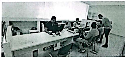
Evidencia 3. Módulo faltante en educación.