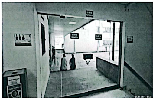
Ilustración 1. Puerta de Vidrio - Salida de emergencia