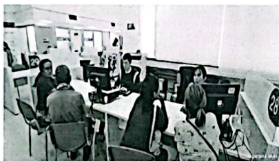
Evidencia 1. Módulo faltante en desarrollo social.