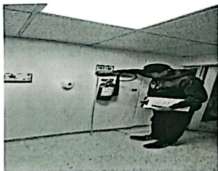
Ilustración 7. Reubicar los equipos de emergencia