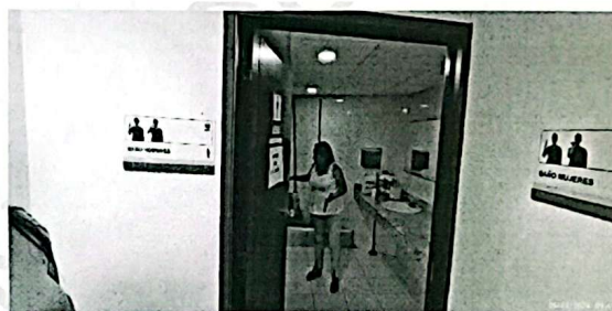
Ilustración 4. Baños que se proponen habilitar al público.