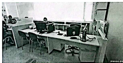
Evidencia 2. Módulo faltante en planeación.