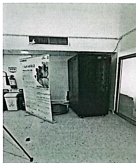
Ilustración 6. Se sugiere encerramiento del RACK de comunicaciones.