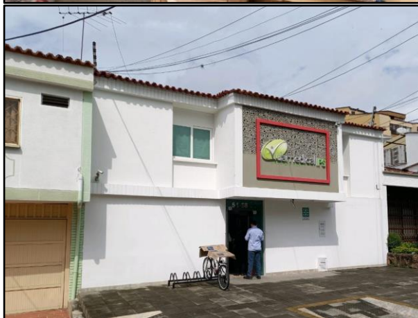
Registros fotográficos 17 a 26: Recolección selectiva de material reciclable comuna 12 vigencia 2021.