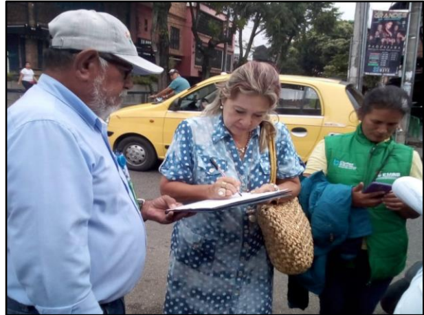
Registros fotográficos 1 a 12: Jornadas de sensibilización comuna 12 vigencia 2020.