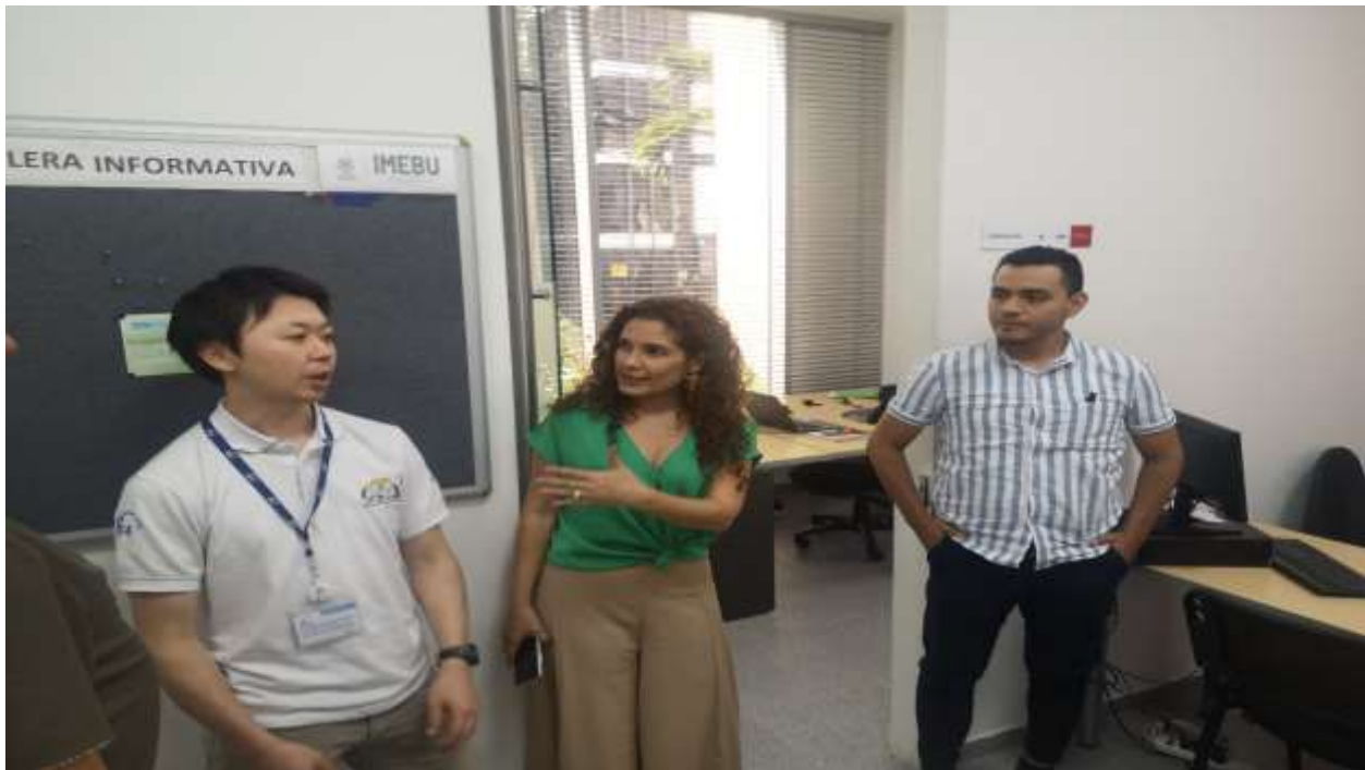
Visita al IMEBU