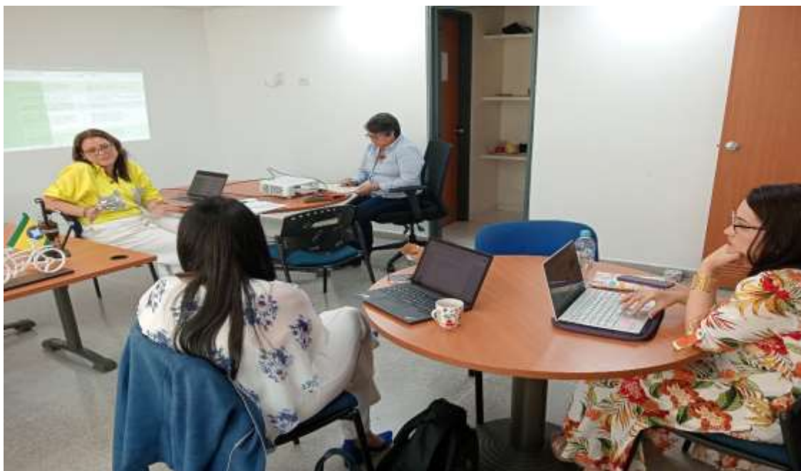
Reunión con especialista de FDN – Oficina Asesor TICS

En estos momentos, personal técnico de la FDN está en el proceso de análisis de la información financiera del municipio y para el último trimestre de este año, se espera conocer la conclusión de dicho análisis financiero y económico, para establecer capacidad de retorno en un posible financiamiento de alguno de los proyectos estratégicos que se vienen revisando.