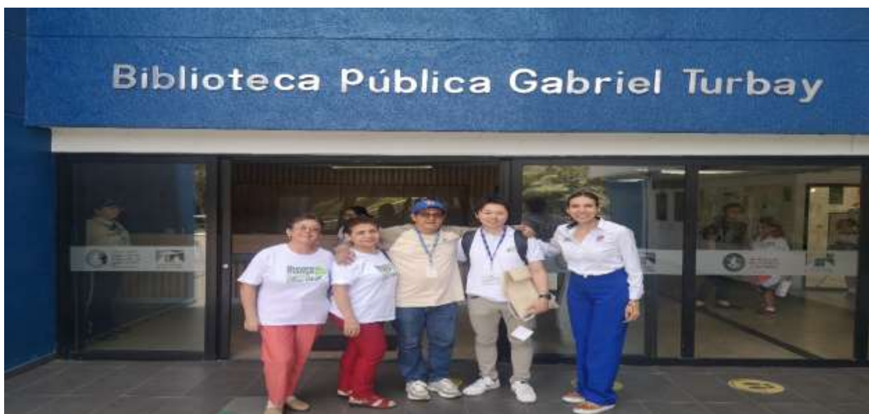
Visita al IMCT