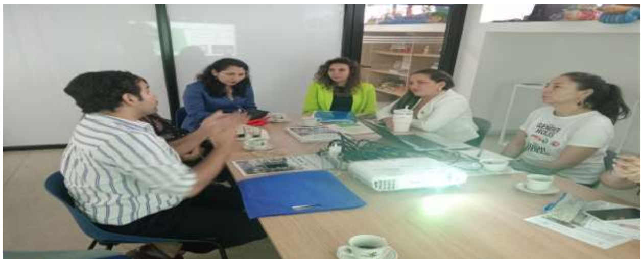
Imagen de la reunión presencial (Dic) realizada en IMCT.

Gracias a lo acordado en dicha reunión, en el mes de diciembre tuvimos la visita oficial de la diplomática peruana en Bucaramanga, con el fin de iniciar la revisión de posibles proyectos binacionales, entre otros.