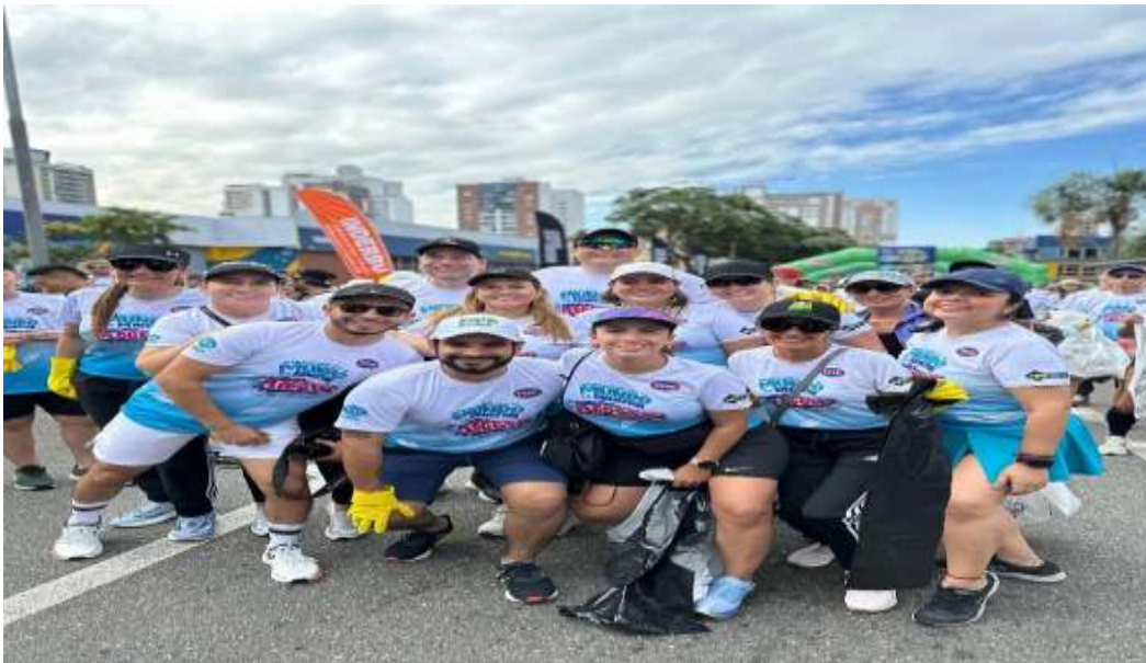
Imagen de algunos participantes en la carrera de plogging