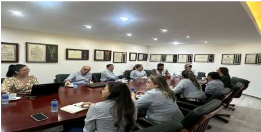
Presentación de la feria a la Cámara de comercio