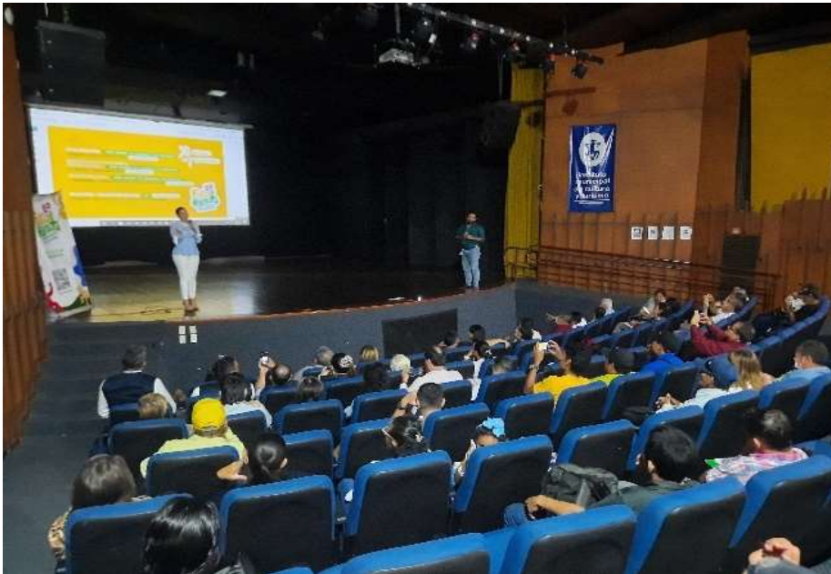
Presentación de la feria a ediles y representantes