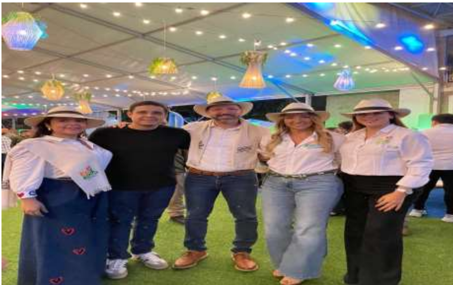
Presentación de la feria a alcaldes y secretarios de cultura y turismo