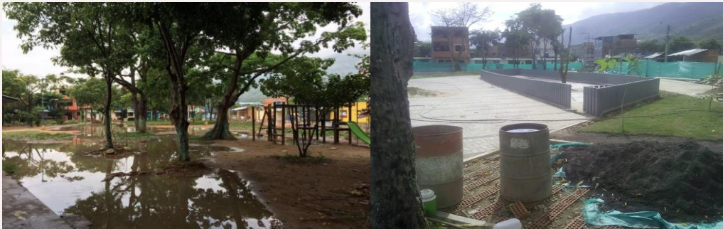
Ilustración: obras Parque Café Madrid

Se encuentra pendiente un adicional en plazo por el tema de las luminarias