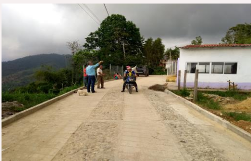
San Pedro bajo - Escuela