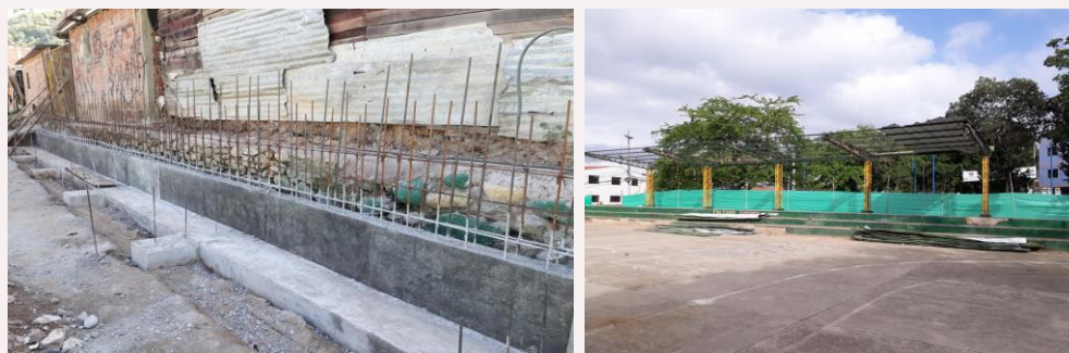
Ilustración: Obras Cancha Barrio Café Madrid y Cancha Barrio La Joya