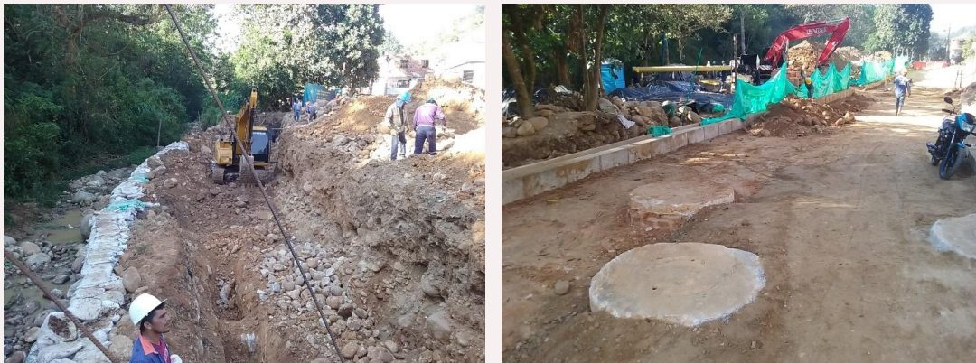
Ilustración: Obras Parque y Cancha Barrio Cristal Bajo

La obra presenta un porcentaje de avance aproximado del 30%, representado en las actividades de movimientos de tierras, redes de infraestructura (alcantarillado de aguas lluvias y eléctricas), cimentaciones, urbanismo y el inicio de la actividad de muros en gaviones, que son parte de las obras de mitigación sobre la quebrada la Cuellar, aprobadas mediante adición presupuestal.