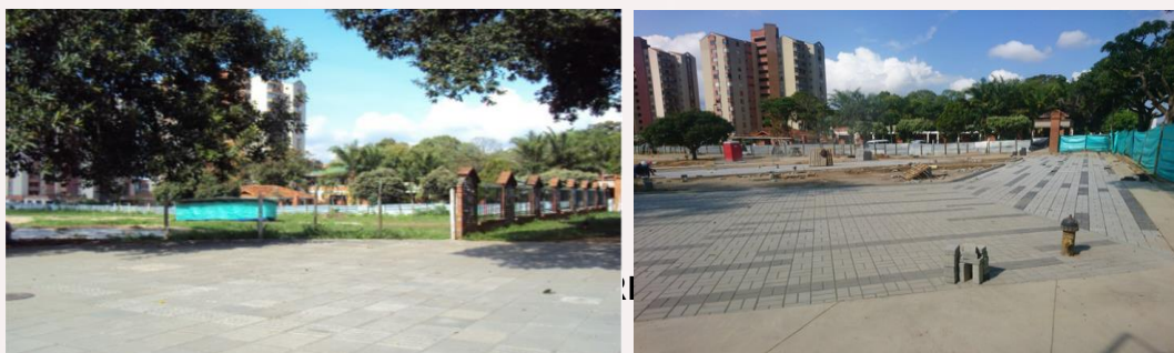
Ilustración: obras Parque Boca Pradera, Barrio Ciudadela Real de Minas