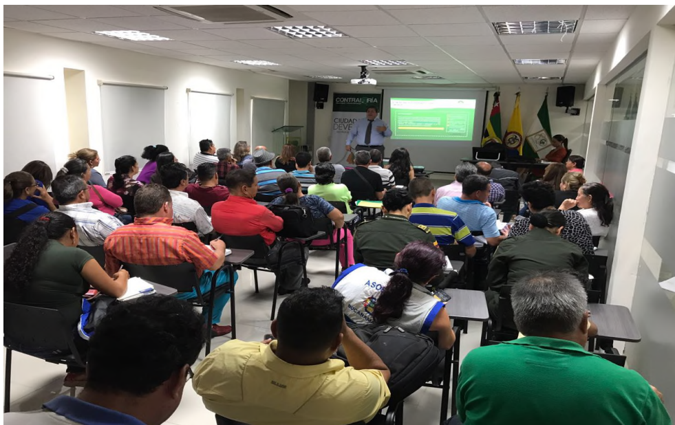
Fuente: Oficina de Participación capacitación control fiscal y veedurias

En lo correspondiente a capacitaciones la Contraloría Municipal de Bucaramanga a través de la Contraloría Auxiliar para la Participación Ciudadana y atención a la ciudadanía y en alianza estratégica con la ESAP, en donde se realizaron dos capacitaciones en temas como: Control Fiscal y Veedurías, los días 18 y 28 de julio.