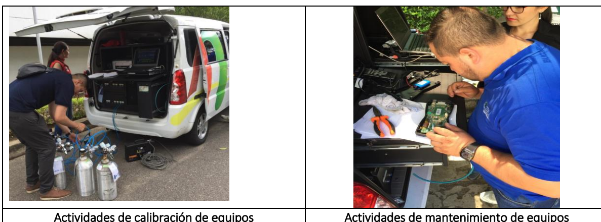
Actividades de calibración de equipos

Se culminó con la ejecución del contrato N° 000160 de 2019 para el servicio de mantenimiento, suministro de consumibles y calibración de los equipos de medición de gases propiedad del AMB.