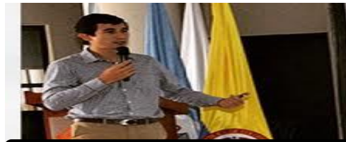
SUBSECRETARIO DEL INTERIOR

La Secretaría del Interior tiene dentro de su eje misional velar por la seguridad y la convivencia ciudadana en el Municipio, en consecuencia, centra sus esfuerzos en actividades que apunten a disminuir las conductas delictivas y generaciones para la resolución de conflictos, la convivencia y el fortalecimiento de la vigilancia en el ente territorial.