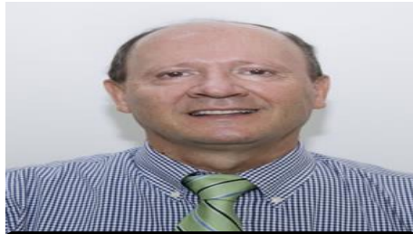
SECRETARIO DEL INTERIOR